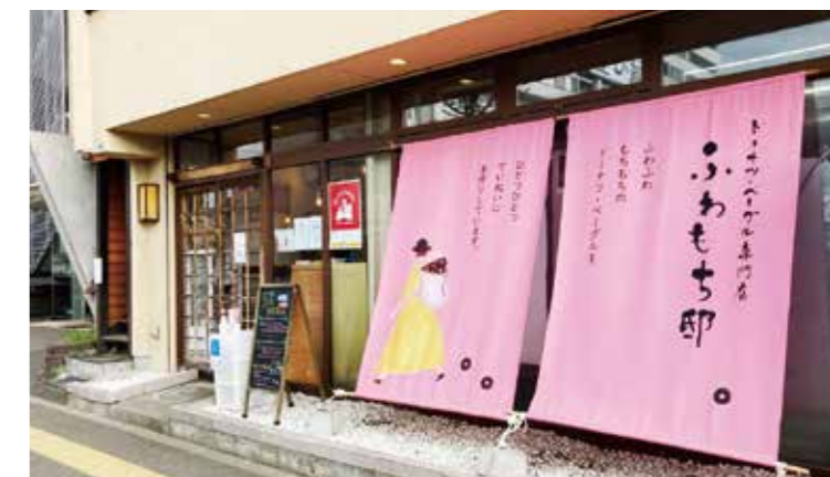
▲今回のおやつ仕入れ先「ふわもち邸」。天然酵母や道産小麦などの食材にこだわり、食感を大切にドーナツ・ベーグルを手作りする体にやさしいおやつ専門店です。

今回は1日だけの開催になりましたが、いつもとは違うおやつを提供を行い、利用された皆様からは良い笑顔がたくさん見られました。感染対策はまだ続いているますが、このような活動が増えてくると嬉しく思います。