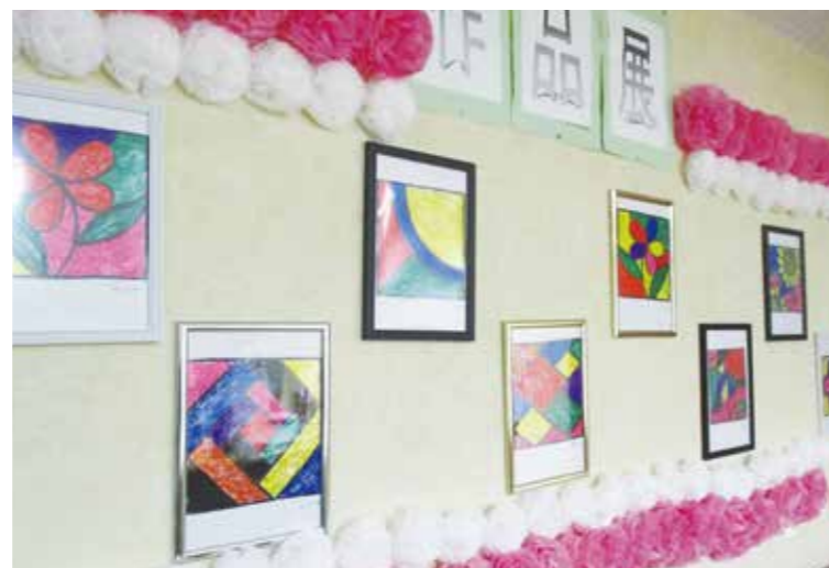
▲参加型の壁画アート作品。季節ごとに力作が壁を飾ります。

コロナが5類に移行しましたが、外出行事などコロナ前に行っていた『楽しみ』は未だに制限されています。利用者みなさんが退屈しないよう、「施設内でも何か楽しい事を」と考え、入居フロアでは様々な制作レクを行っています。秋に作成したのは『手作りステンドグラス』。絵柄の付いた透明なアクリル板に、ご自分で好きな色を塗ってもらいました。裏からアルミホイルを重ねると、光を反射してとても綺麗な作品に仕上がりました。皆さん思いおもいの色を楽しそうに塗っているのが印象的でした。これからは素敵な制作レクの様子などを本誌でご紹介していきますので、お楽しみに♪